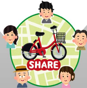
施設や他団体と 共有する器材