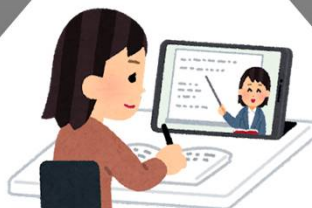
ボランティア研修・資格取得 のための器材・費用 * 手話通訳者養成のため の器材は含まない。