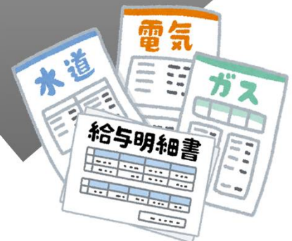
一般管理事務を 行うための器材・費用