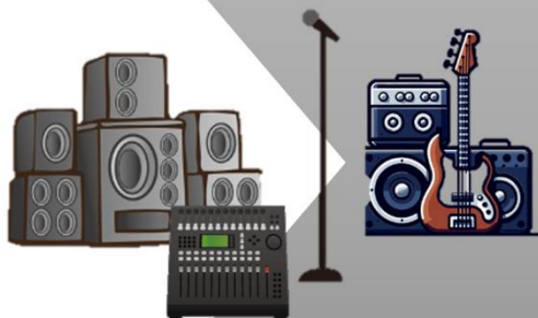
高出力アンプ・スピーカー等 その他イベント用器材・費用