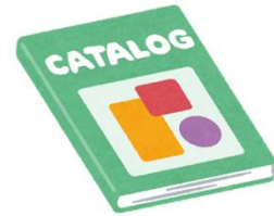
パンフレットカタログ