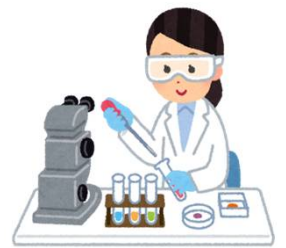
調査研究の器材・費用