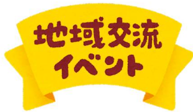
イベント開催費用