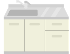
シンク等キッチン設備・洗面台・給湯 器などの給排水設備及び冷暖房等 空調設備等の住宅設備機器