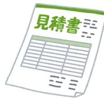
見積書 (相見積もり)