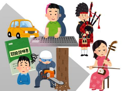
使用できる人が限定される 器材・楽器等